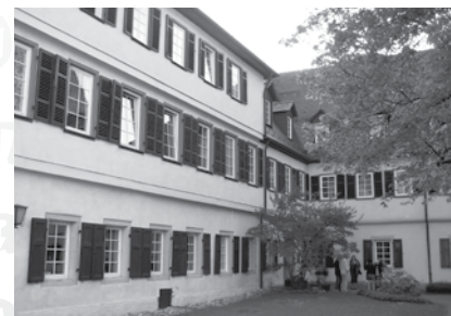
Urach – tiskarna, prvi biblični zavod

Lepo je biti državljani Slovenije, a to državljanstvo je vendar nekaj omejenega in začasnega. Cilj vseh ljudi, tudi Slovencev, je namreč za celo neskončnost višji: postati državljani Božjega kraljestva! Postopek, ki je potreben za pridobitev te pravice, pa nam je pokazal Primož Trubar, ko je prvi prevedel vse štiri evangelije v slovenski jezik in tako med preprostimi slovenskim človekom in njegovim Bogom ni bilo več drugih srednikov kakor Jezus Kristus. Bog je, po Trubarjevi zaslugi, spregovoril tudi v slovenščini.